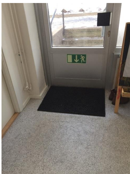
Figur 8. Utrymningsväg vid personalutrymme.

Utrymningsvägar består av två dörrar, entré samt dörr vid personalutrymme (se figur 8), och två fönster. Dessa fönster är extra djupa för att möjliggöra utrymning, se figur 9 och 10.