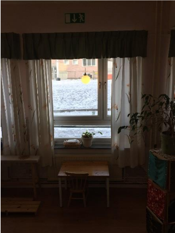
Figur 5. Utrymningsväg via fönster i Solrosen.