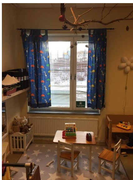
Figur 9. Utrymningsväg via fönster, extra djupt.