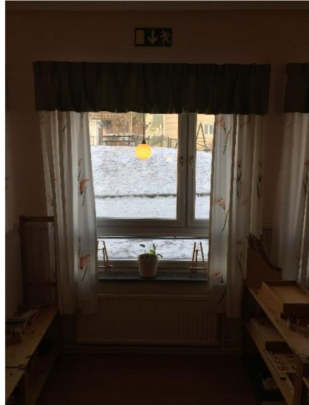
Figur 6. Utrymningsväg via fönster i Solrosen, fönster längst åt höger markerad på figur 3.