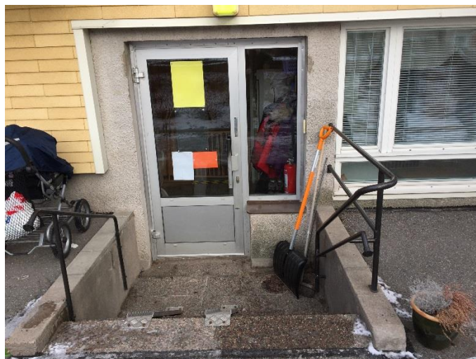
Figur 2. Entré till Grossgårdets förskola avdelning Fröet.

Planritningar till respektive lokal kan ses i respektive utrymningsplan, se figur 3 och 4 nedan.