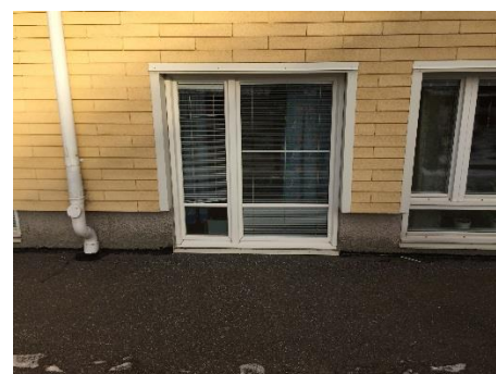
Figur 10. Utrymningsväg via fönster sett utifrån, extra djupt.