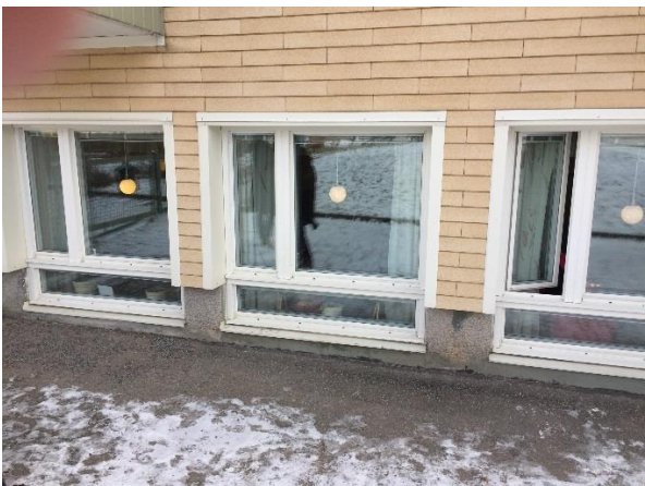
Figur 7. Utrymningsväg via fönster i Solrosen, sett utifrån, samma fönster som figur 5.

POSTADRESS Box 802, 761 28 Norrtälje ORGANISATIONSNUMMER 212000-0217