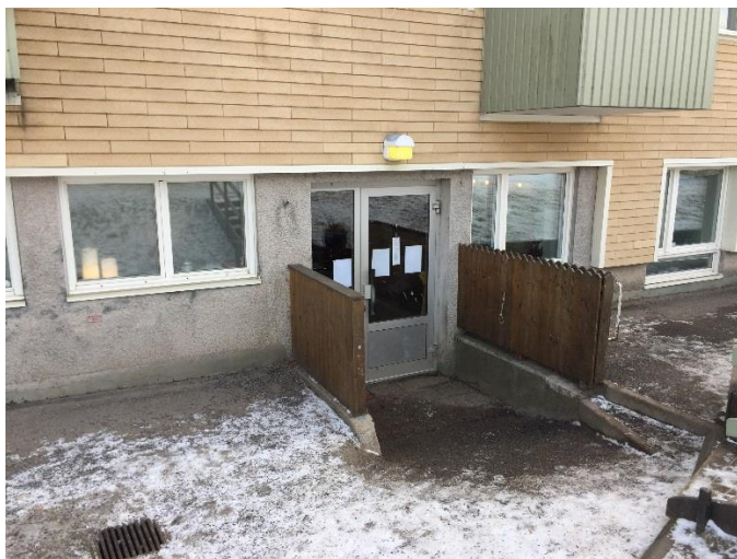
Figur 1. Entré till Grossgårdets förskola avdelning Solrosen.

Byggnaderna är uppförda runt 1958 i 3 plan exklusive vind och källare. Verksamheten bedrivs i källarvåningen (suterrängvåning) i bägge hus, se figur 1 och 2 nedan för respektive entré.